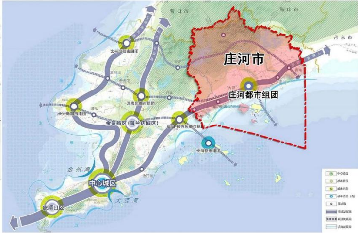
庄河市在大连市区位