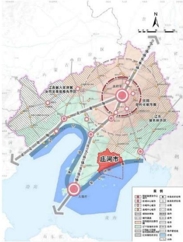
庄河市在辽宁省区位