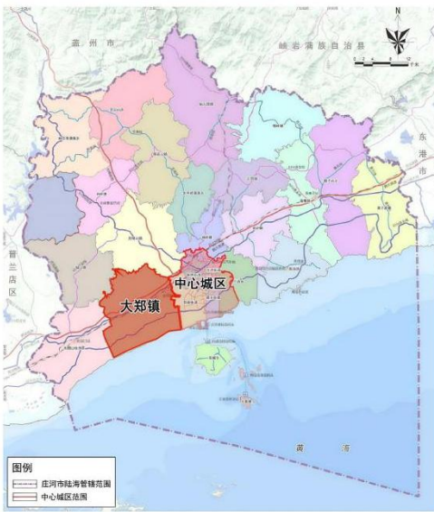
大郑镇在庄河市区位